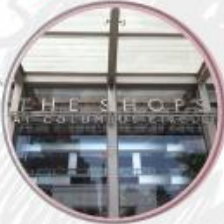
$1,600 SHOPS EN COLUMBUS CIRCLE, NUEVA YORK