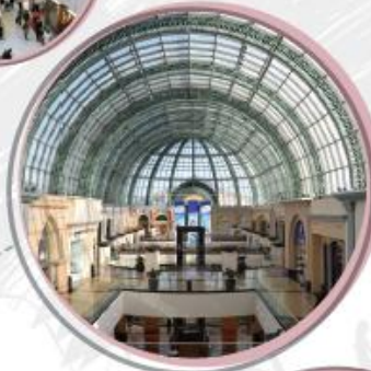
$1,423 MALL DE LOS EMIRATOS DUBAI, E.A.U.