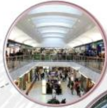
$1,110 BRENT CROSS, LONDRES