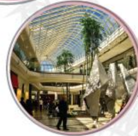
$1,157 CHADSTONE MELBOURNE, AUSTRALIA