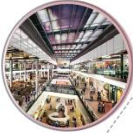
$1,600 WESTFIELD STRATFORD, LONDRES