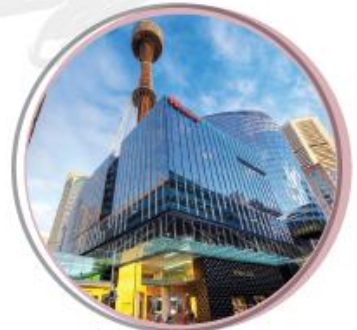
$1,500 WESTFIELD SYDNEY, AUSTRALIA