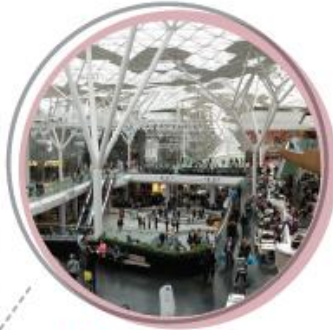
$1,600 WESTFIELD LONDON, LONDRES