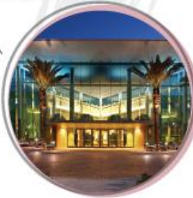
$1,250 THE MALL AT MILLENIA, ORLANDO, FLORIDA